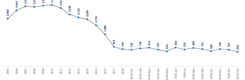
Oferta neta de gas de Pemex (MMpcd)