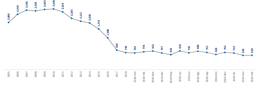
Oferta neta de gas de Pemex (MMpcd)