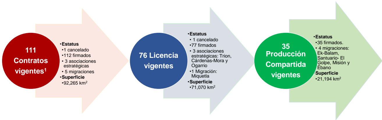
Etapa de contratos por cuenca 2