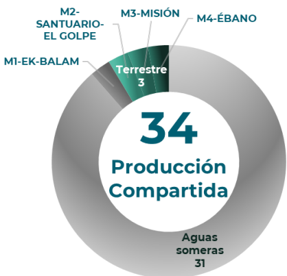
Contratos vigentes de Producción Compartida por ubicación